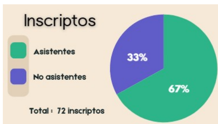
Figura N° 4