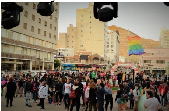
Figura 2. Marcha del Orgullo 2018-2019.