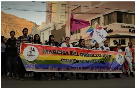
Figura 1. Marcha del Orgullo 2018-2019.