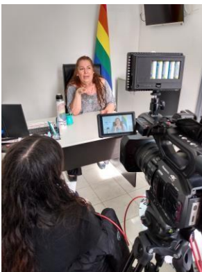
Figura 5. Las entrevistas.

Nota. Imagen de “Familias en el viento”.