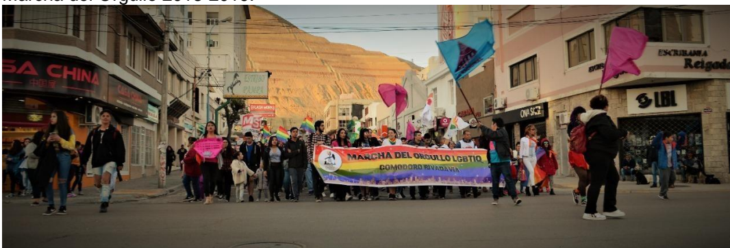
Figura 4. Marcha del Orgullo 2018-2019.