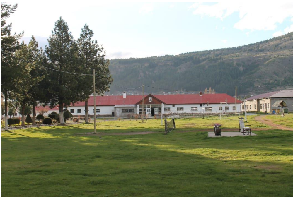
Vista del penal desde la calle Av. Ameghino. (15/09/2021)