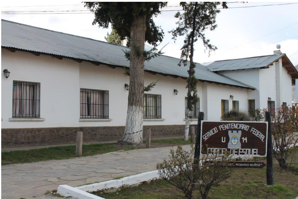
Cartel acceso a la Unidad. Fuente: autoría propia con la colaboración de Ibaldi, Soledad. (15/09/2021)