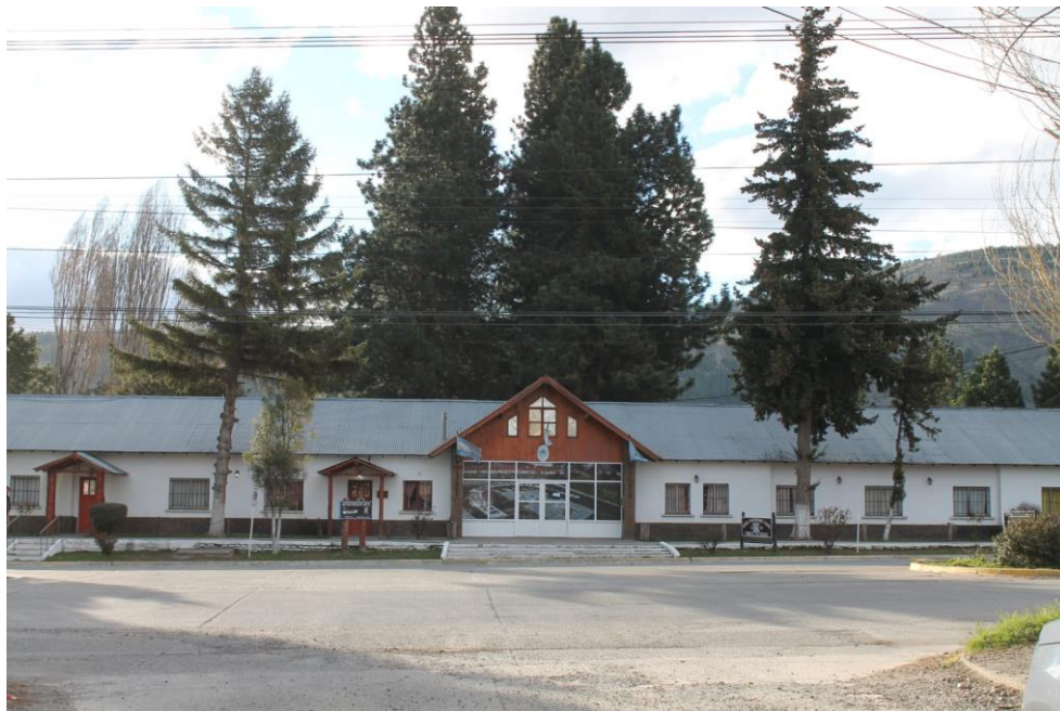
Vista frontal. Fuente: autoría propia con la colaboración de Ibaldi, Soledad. (15/09/2021)