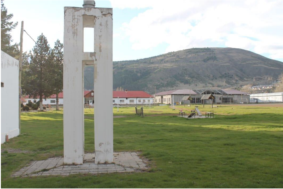
Vista del penal actual, del que está en construcción y del hospital modular desde otro ángulo. Fuente: autoría propia con la colaboración de Ibaldi, Soledad. (15/09/2021)