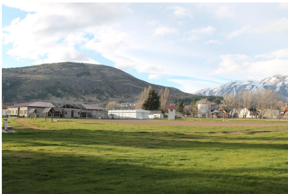
Vista del penal en construcción y del hospital modular. Fuente: autoría propia con la colaboración de Ibaldi, Soledad. (15/09/2021)