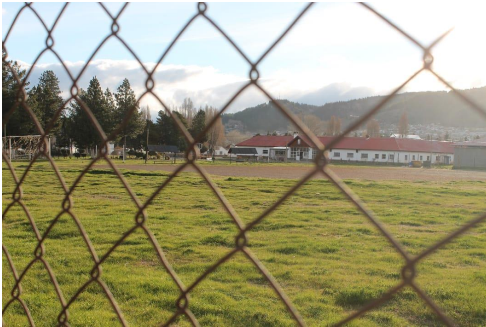
Vista al penal desde otro ángulo. Fuente: autoría propia con la colaboración de Ibaldi, Soledad. (15/09/2021)