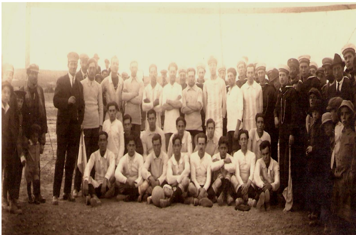
1920 Trelew Athletic Club vs. Fragata Sarmiento en Puerto Madryn