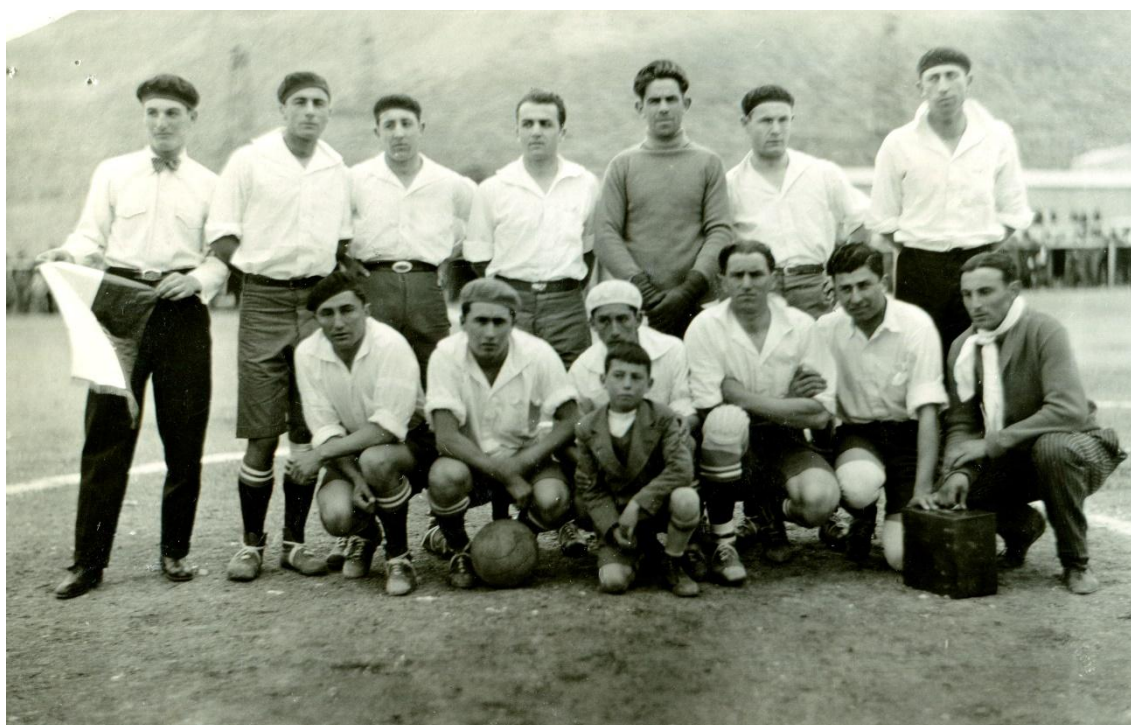
1934 selección del Valle en Comodoro Rivadavia

Durante varias emisiones opinan sobre cómo debería formar el equipo representativo, el cual es seleccionado entre los jugadores de la zona que juegan en partidos amistosos. Las opiniones crean controversia entre el Semanario de Trelew y el Semanario Del Golfo de Puerto Madryn que ponen la misma sobre los jugadores que deben integrar el representativo de la Asociación Deportiva de Chubut, y sería lógico inferir que en Rawson también.