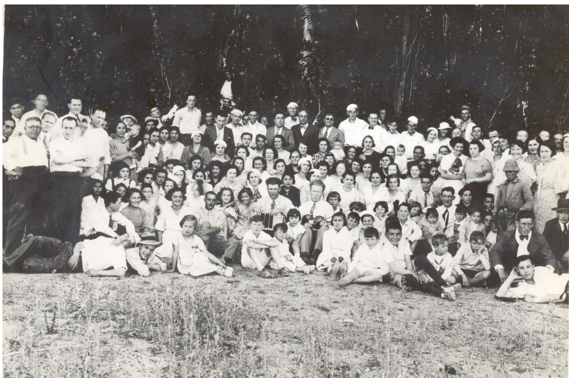
Picnic del National Racing Club 1927 en chacra de la flia Kresteff.

En el semanario “ El Pueblo ” se destacaban los bailes de carnaval organizados por el National Racing Club en el teatro Español, que competían en un mismo fin de semana con los bailes organizados en el casino del teatro Español, el San David y el teatro Verdi los otros bailes eran organizados por el Club Social Trelew por invitación y por el Club Independiente.