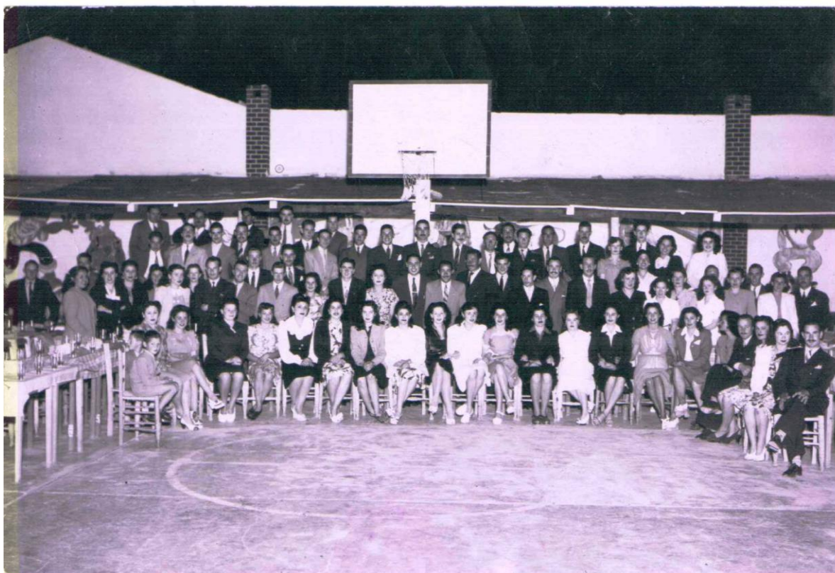
1950 Salón del Molino de Oro antes de ser techado