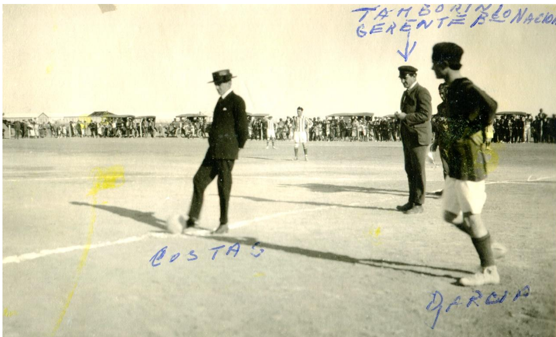
1925 El gobernador Costa da el puntapié inicial partido entre Germinal e Independiente.

Así transcurrió la actividad futbolística, siguiendo con los desafíos y partidos pactados hasta el año 1926, cuando se logra reunir a los presidentes de los clubes que practicaban fútbol en la zona en una asamblea que se concretó en el Club Social de Trelew. Bajo el liderazgo de José Ghio 6 , los clubes se pusieron de acuerdo para organizar, implementar las reglas de la actividad y competir en un torneo.