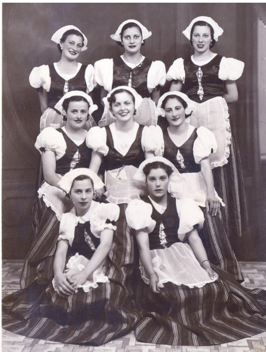
1940 las chicas del National Racing Club.

tiempo ocuparon un lugar en la sociedad trelewense, por su actividad comercial, social o política.