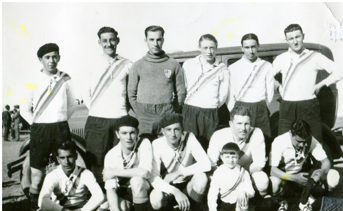
1936 Unión River Boca foto (gentileza flia Quiroga)

Estos torneos eran protagonizados por equipos de fútbol formados por pobladores de chacras del valle, que disputaban un campeonato organizado por la denominada Liga Deportiva del Valledel cual participaban, Defensores de Valle (Drofa Dulog), Atlético del Valle (Puente Hendre), Nacional de Treorkey, All Boys de Bryn Gwyn, El Celta Argentino (Bryn Crwn), Villa Inés (Gaiman). De todos estos equipos Villa Inés compitió en los torneos oficiales con un equipo de la 2da división en 1936 y hoy solamente perdura Defensores del Valle sin participar en campeonatos oficiales.