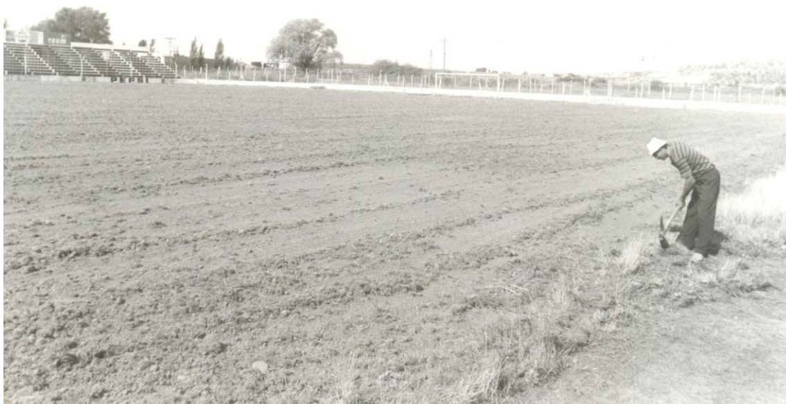
1979 Preparando el terreno de la cancha para la siembra del césped