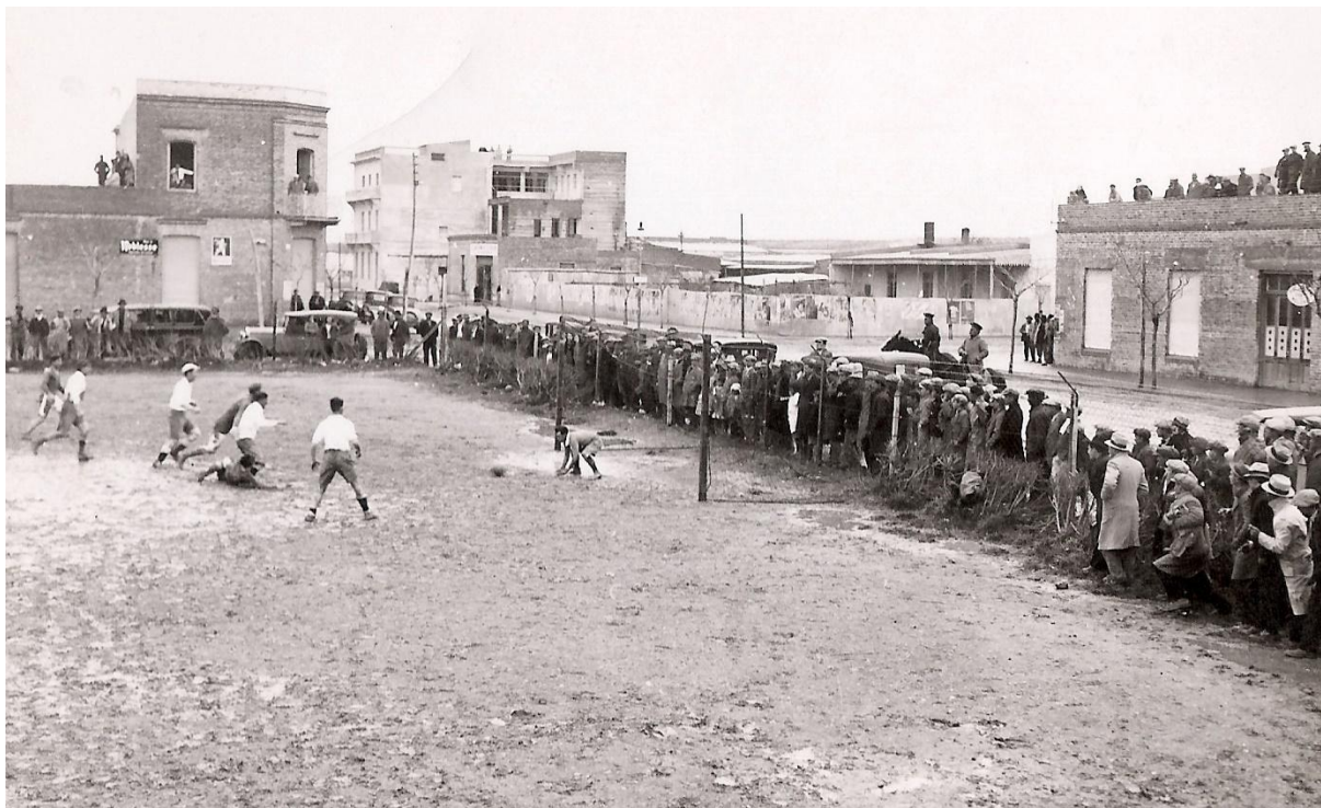
Circa 1923 Pellegrini y 25 de Mayo partido de futbol

El voto, de acuerdo al modelo que adjuntaba a su publicación se depositaba en una urna del periódico, comprometiéndose el mismo a publicar el escrutinio de los votos. Destacando al final de las bases del concurso que: “empleando toda nuestra influencia, haremos todo lo posible para que la fotografía de los ganadores de nuestro concurso aparezca en varios diarios y revistas de la Capital Federal haciendo así más vasta nuestra propagandadeportiva.” (El Pueblo Jun.1922)