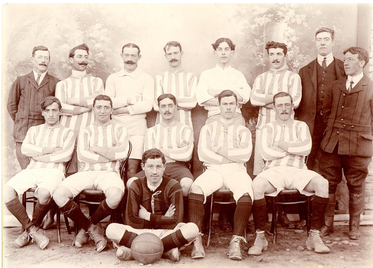
1911 Trelew Athletic Club