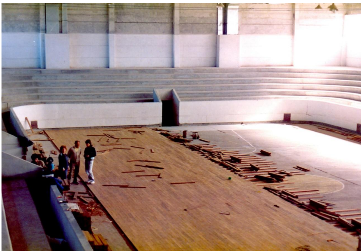
1987 colocación del piso de lapacho

La firma GALVATEX concluyó la instalación de la calefacción en el gimnasio, en el mes de noviembre la firma que proveyó del piso de Lapacho paraguayo envió operarios para la colocación de este, finalizado el trabajo en el mes de diciembre de 1987.