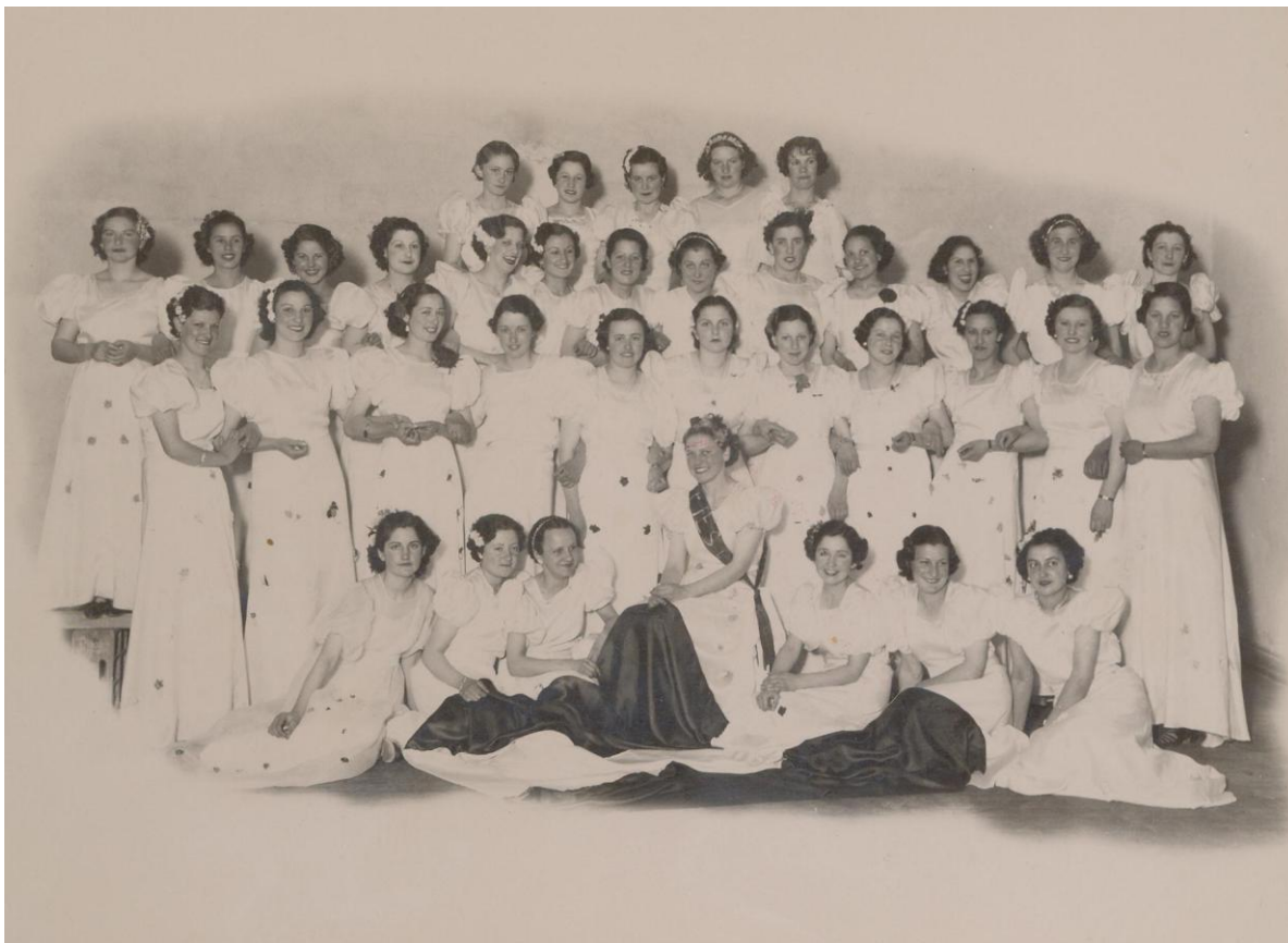
Las chicas del National año 1936 festejo aniversario del Club, foto (gentileza flia Dioniso Velázquez)

Esto se puede apreciar en los documentos fotográficos de las familias que fueron parte de ese colectivo social, como la foto enmarcada por la Casa de Fotos Stillitani, que el Club obsequio a cada una de las 36 chicas de entre 15 y 25 años que participaron y colaboraron en la organización de los festejos de sus 16 años del Club, todas vestidas igual para la ocasión. al dorso de la foto una nota que dice: