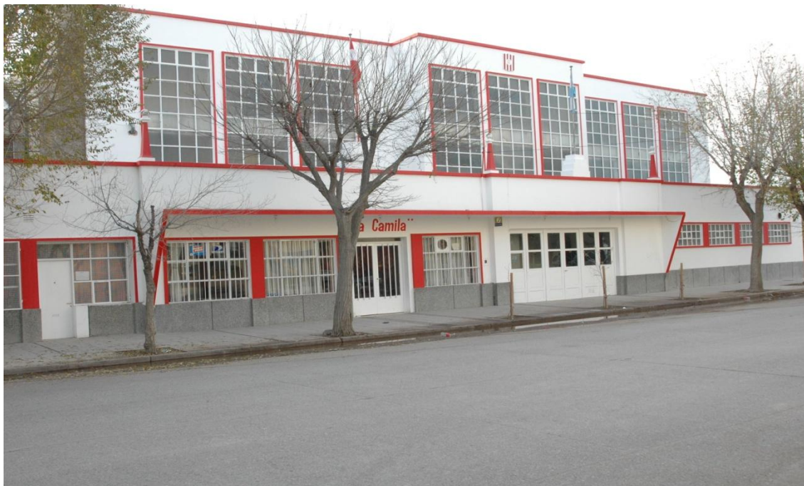
Sede social del Racing Club de Trelew foto (archivo del club)

La misma consta de una cancha de pelota a paleta cubierta, con dos palcos para el público que asiste a los encuentros, vestuarios, sala de masajes, hall de entrada, salón para el uso de socios con Bar y Cafetería y dos dependencias para la secretaria y Presidencia del Club.