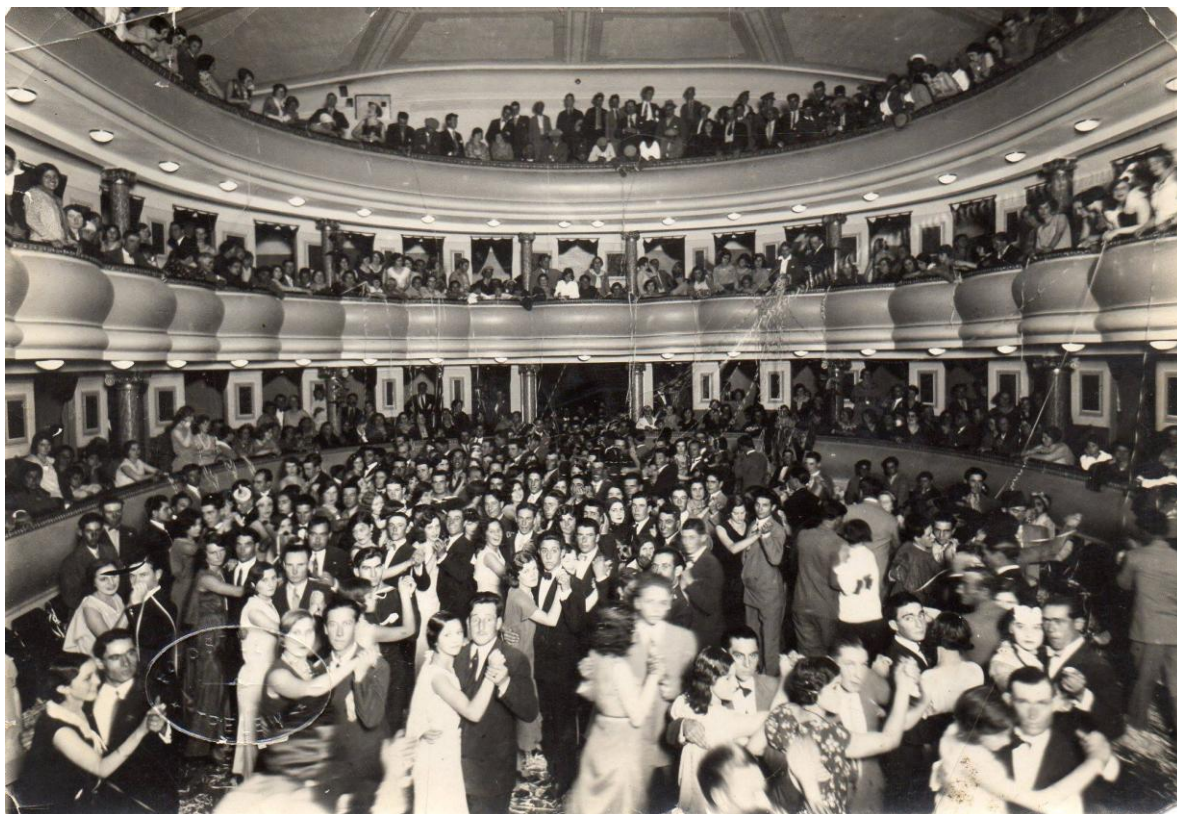
Baile en el Teatro Español

Con respecto a los bailes o reuniones danzantes como las denominaban en aquella época estas se realizaban en el Teatro Español, o el Teatro Verdi que eran alquilados para estos fines.