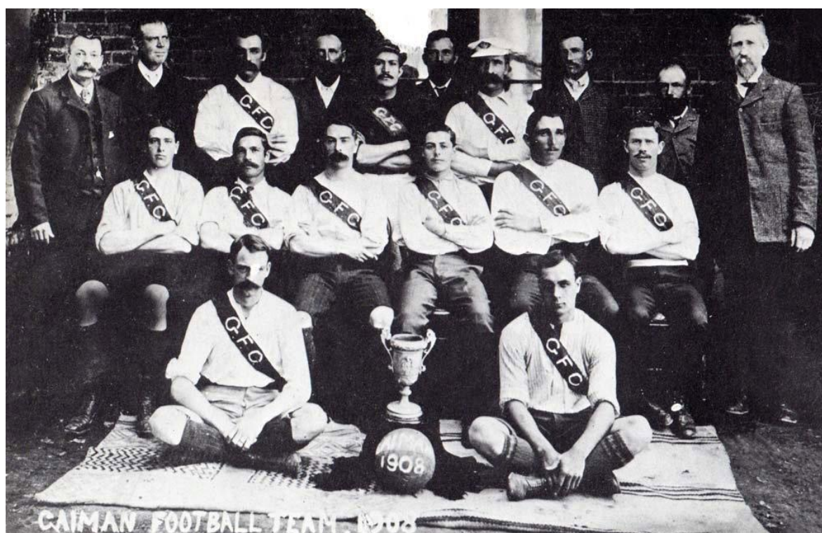
Equipo representativo de Gaiman 1908

Desde las páginas del semanario se alienta a los vecinos a interesarse en lo que denomina “Juegos atléticos” , asimismo se insta a los comercios a dar a los empleados algún tiempo libredurante la semana para que puedan practicar o ejercitarse en este nuevo deporte, declarándose el cronista poco competente para juzgar el desarrollo de los partidos, por no conocer acabadamente las reglas del juego,