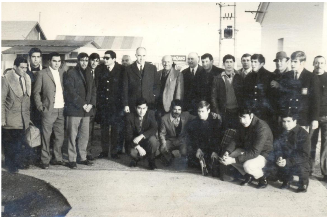
Delegación del Racing Club antes de partir a Mar del Plata