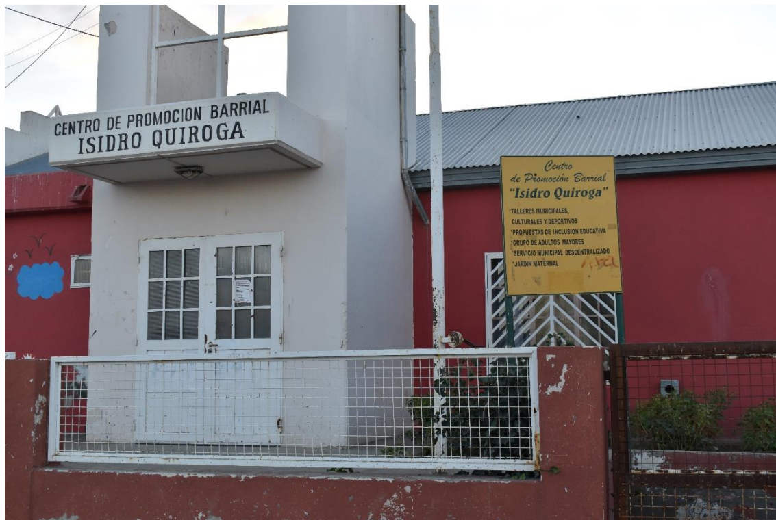
CENTRO DE PROMOCION BARRIAL ISIDRO QUIROGA.

FOTOS DEL BARRIO Y DE ALGUNAS INSTITUCIONES :