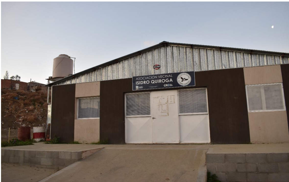
FOTO DEL AÑO 2019. ASOCIACION VECINAL DEL BARRIO ISIDRO QUIROGA. (INAGURADA)