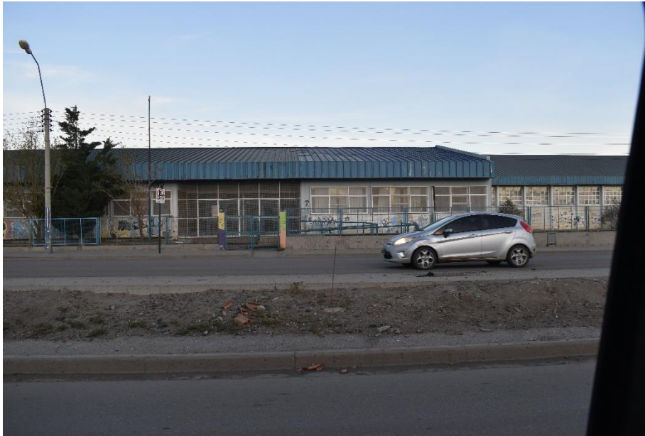
ESCUELA SECUNDARIA 723