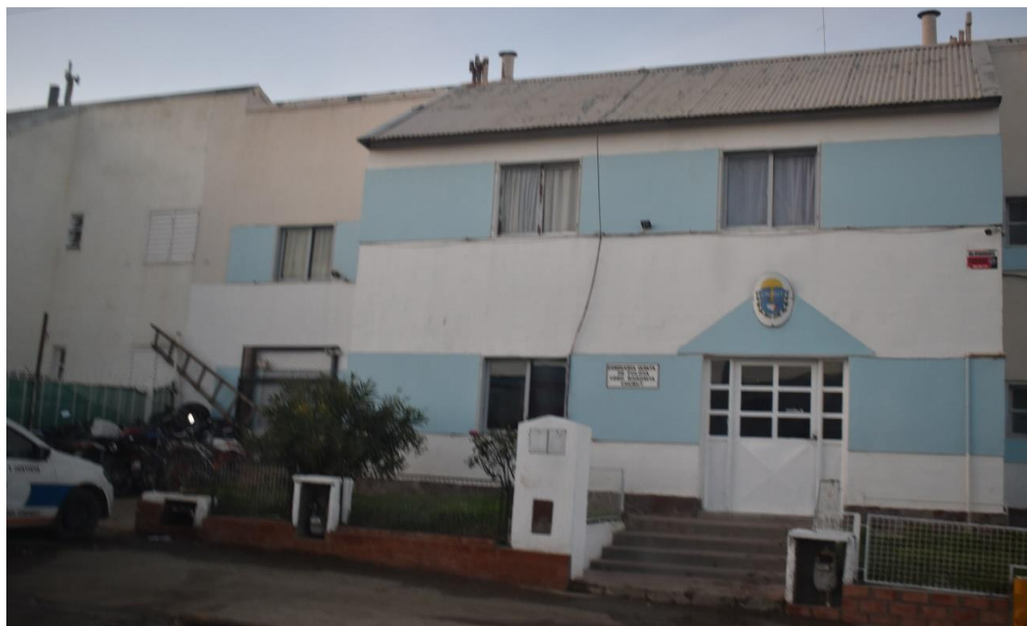
SECCIONAL 5ta DE POLICIA DE CHUBUT.