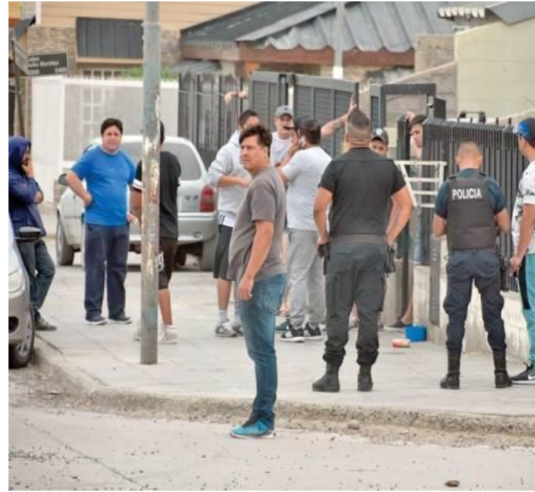
LUGARES CONFLICTIVOS DEL BARRIO.