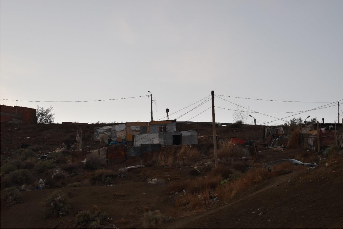
SECTOR DE OCUPACIONES ILEGALES DE LA ZONA ALTA DEL B° ISIDRO QUIROGA.