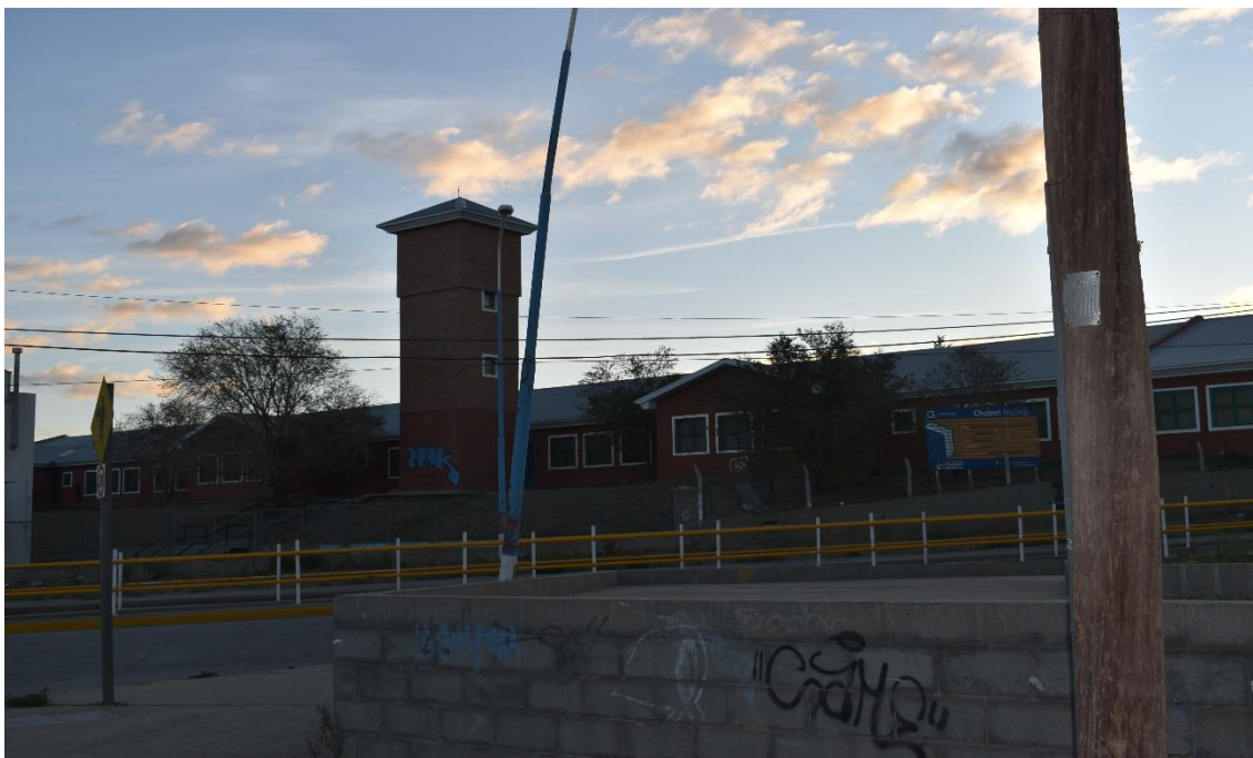
JARDIN INFANTES N° 413