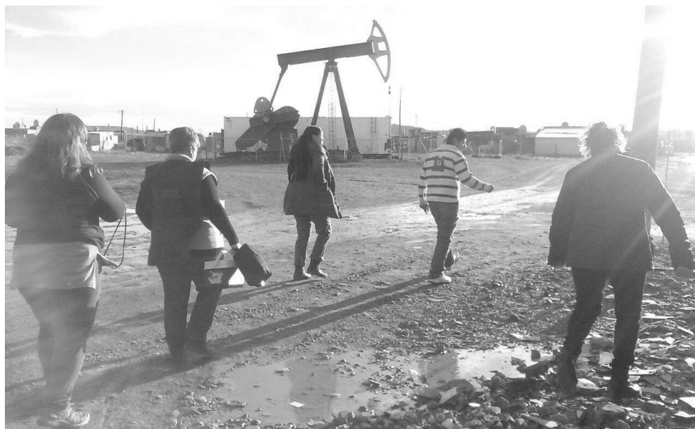
Foto 5: La cigüena de petróleo es una postal característica del barrio.

Contrariamente a lo que estipula la Ley de Hidrocarburos de Chubut, en el barrio coexisten, junto con las viviendas, pozos petroleros inactivos sin sellar. Inclusive, muchos continúan funcionando a tan sólo metros de algunas casas. Asimismo, líneas de gasoductos y de oleoductos atraviesan el asentamiento. Todos estos son factores de riesgo para la salud, además de significar un alto grado de contaminación. Además, durante el tiempo en que se realizó la presente investigación, los camiones de recolección de residuos no ingresaban al lugar, generándose una importante acumulación de basura en algunos sectores 9 .