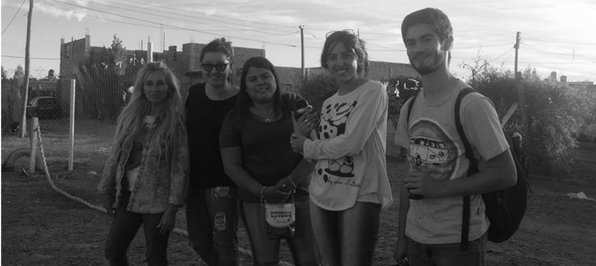
Foto 16: Integrantes del espacio comunitarios durante actividades en la plaza.