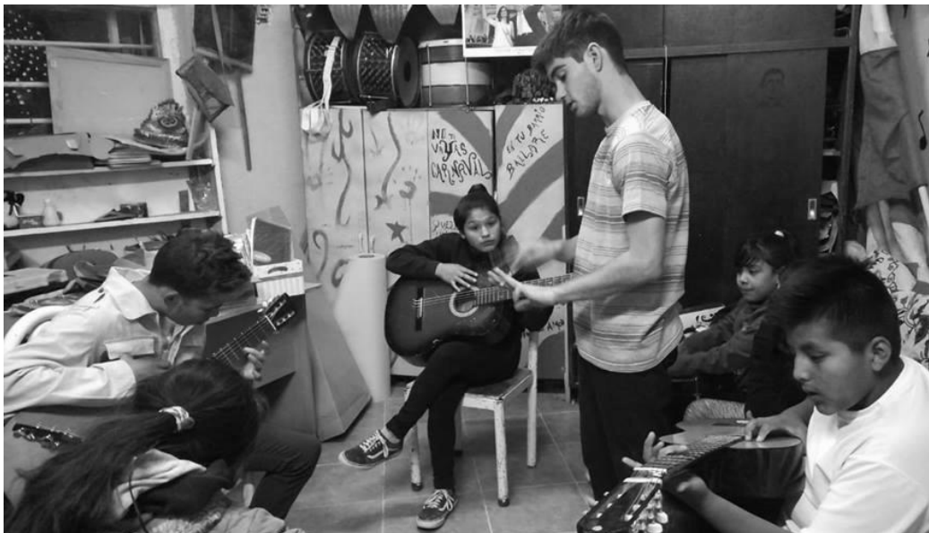
Foto 18: Taller de guitarra en el espacio comunitario Carlos Mugica.

https://drive.google.com/file/d/1zY1XwNQiDtc8ueHoRVGfWi-FDQOzTGwk/view?usp=sharing