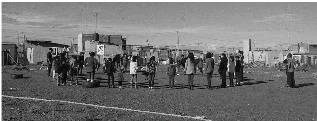
Foto 10: Integrantes de La Mirilla proponiendo un juego en la plaza del barrio.

https://drive.google.com/file/d/1yYERtSWFLFQ1x5PGoI9S07-xDgJZxrq4/view?usp=sharing