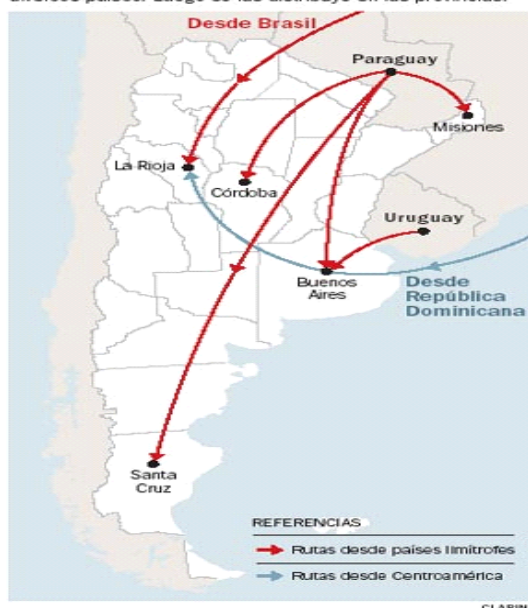
Grafico 2: Rutas de ingreso y egreso de la trata, documento de OIM. (Clarín 2007)

Para hacerlas trabajar en Argentina se traen mujeres desde diversos países. Luego se las distribuye en las provincias.