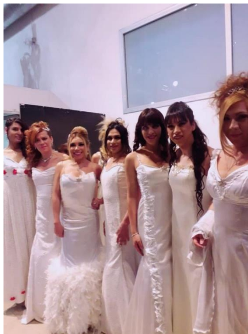
Foto N°25. El desfile de modas de Cooperativa Diversa en Comodoro Rivadavia