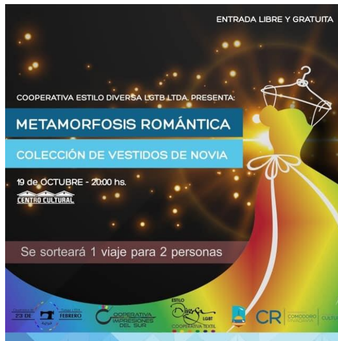
Foto N°24. Flyer de invitación al desfile de modas de Cooperativa Diversa