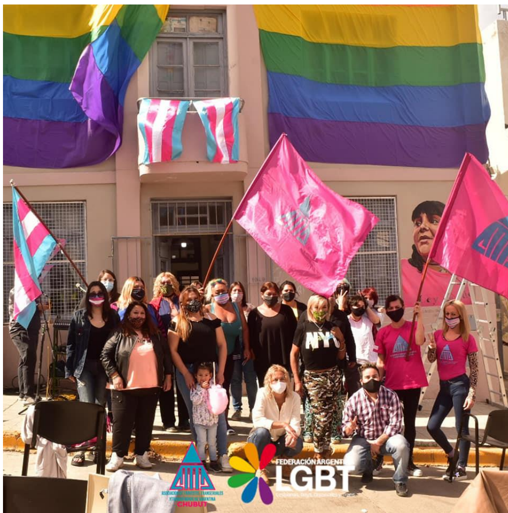
Mural 18 de marzo 2021