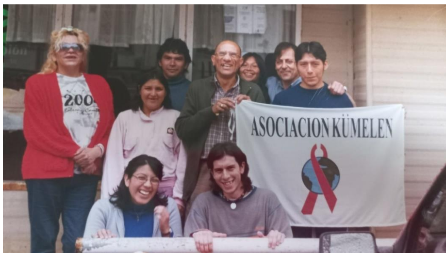
Fotografía N°2. Equipo de prácticas de TS II y Comisión directiva de la Asociación Kümelen + La Carlota