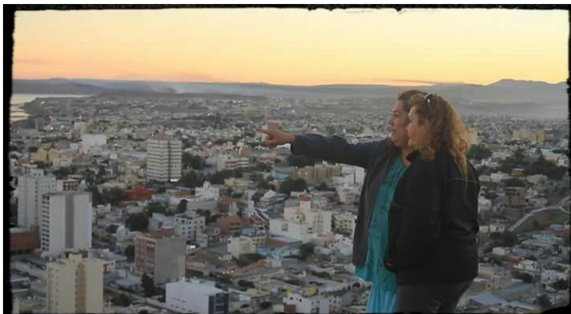
Fotografía N°5. Imagen desde el mirador de Comodoro Rivadavia – Colectivo de las personas trans