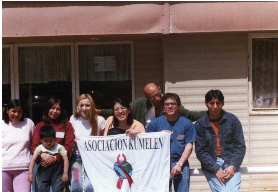
Fotografía N°1. Equipo de prácticas de TS II y Comisión directiva de la Asociación Kümelen